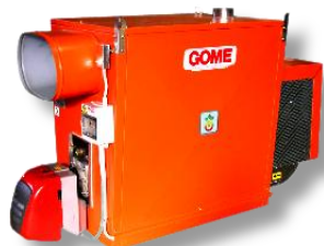
TGS P/C 80