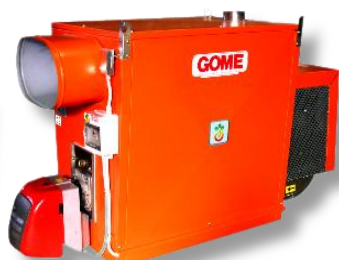
TGS P/C 120