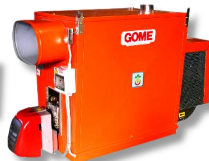
TGS P/C 200